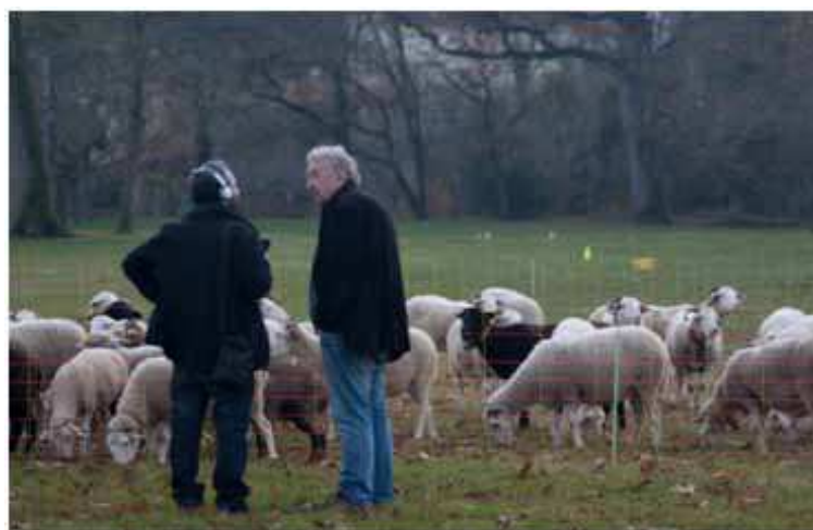
Mobiliser les savoirs locaux, c'est par exemple faire reconnaître les bergers comme acteurs du territoire (Collectif des garrigues)

E n matière de concertation environnementale, les acteurs les plus fréquemment mobilisés sont des groupes organisés : associations, organisations professionnelles, collectivités locales... Mais ce panorama varie selon les situations et évolue depuis quelques années.