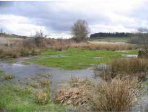
La mobilisation de citoyens dans l'inventaire participatif des zones humides a permis d'améliorer la qualité du repérage (Département de Haute-Loire)

longs pour produire des changements effectifs. Comme dans le cas de la gestion concertée, le dialogue permet à chacun de mieux comprendre la complexité des systèmes et des situations, d'éviter les idées toutes faites, de casser les préjugés et les jugements abrupts.